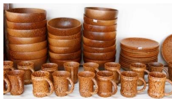
ผลิตภัณฑ์จากกะลามะพร้าว