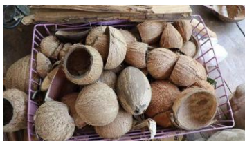
กะลามะพร้าว