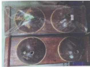
กะลาเหยียบกดจุด