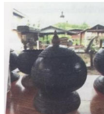
บาตรพระจากกะลามะพร้าว