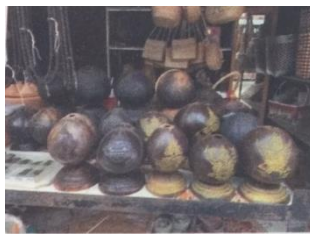
กะลาดาเดี่ยว