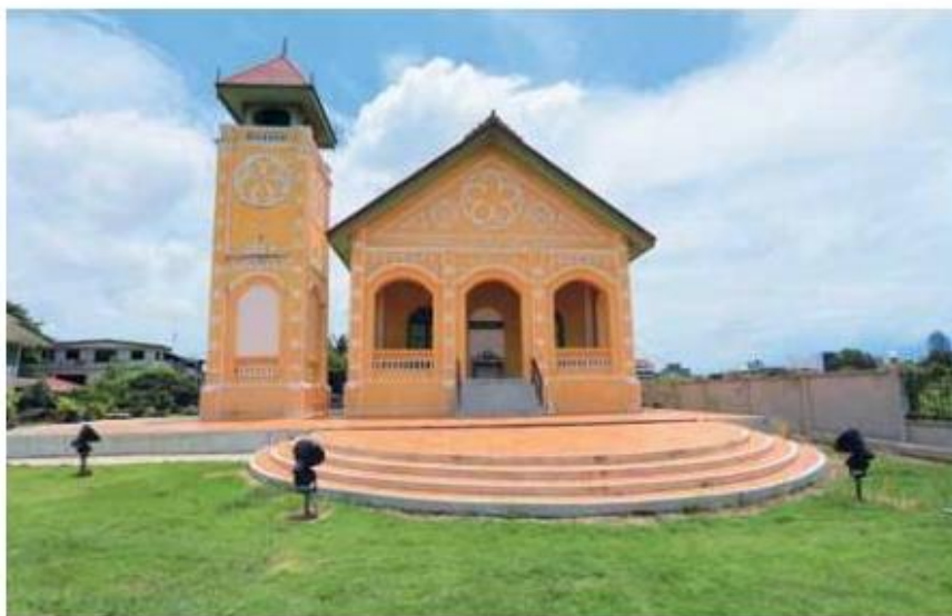
คริสตจักรที่ ๑ สำเหร่ เป็นคริสตจักรแห่งแรกของนิกายโปรเตสแตนต์ ก่อตั้งโดยคณะเพรสไบทีเรียน ใน พ.ศ. ๒๔๐๐

๒.๔ มูลนิธิคริสตจักรเซเวนธ์เดย์แอ๊ดเวนตีสแห่งประเทศไทย